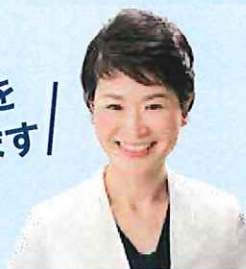
たいらあやこ 前新潟市議(新潟2区重複)