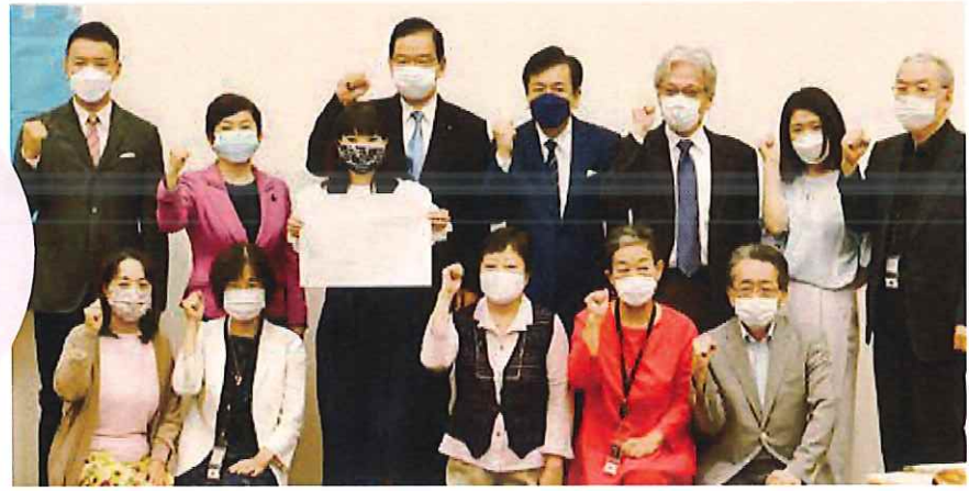
共通政策に合意した市民連合と野党各党党首=9月8日、参院議員会館

2015年、安保法制反対運動の中で、市民と野党の共闘で政治を変える道にふみだしました。この間、2つの大きな前進がありました。1つは9月8日、市民連合と共産・立民・社民・れいわの4党首が野党共通政策(20項目)に合意したことです。安倍・菅政治のチェンジの要になる大事な合意です。