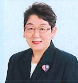
かねもと幸枝 党福井県書記長